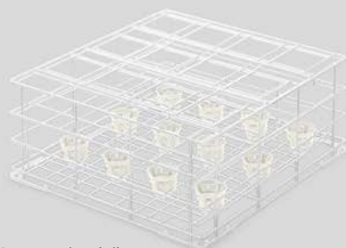
Cesto per bottiglie