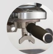
Portafilter PRESTIGE+ Siebträger PRESTIGE+

Beide Versionen sind mit dem einstellbaren Faema Heizsystem ausgerüstet. Aber nur PRESTIGE+ hat die praktischen und leicht zugänglichen Außenknöpfe am Tassenwärmer.