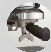
Portafilter PRESTIGE Siebträger PRESTIGE