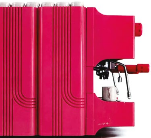
Prestige '70. Side view with a distinctive design. Prestige '70. Seitenansicht mit markantem Design.